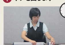
③ 新しいユニットに交換