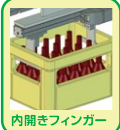
内開きフィンガー