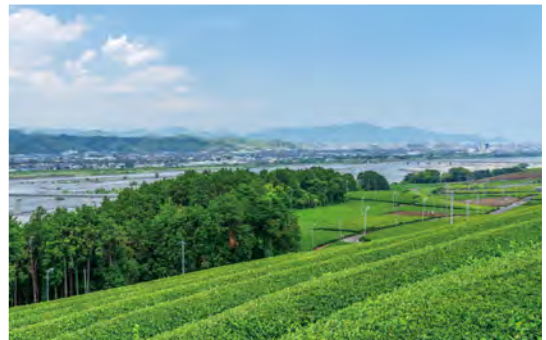
牧之原の広大な茶畑の総面積は練馬区よりも広いそうです。